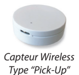
Capteur Wireless Type "Pick-Up"

Ces capteurs communiquent avec la solution intelligente intégrée à la borne (versions 4, 6 ou 8 produits).