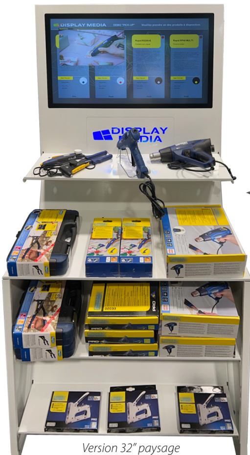
Version 32" paysage