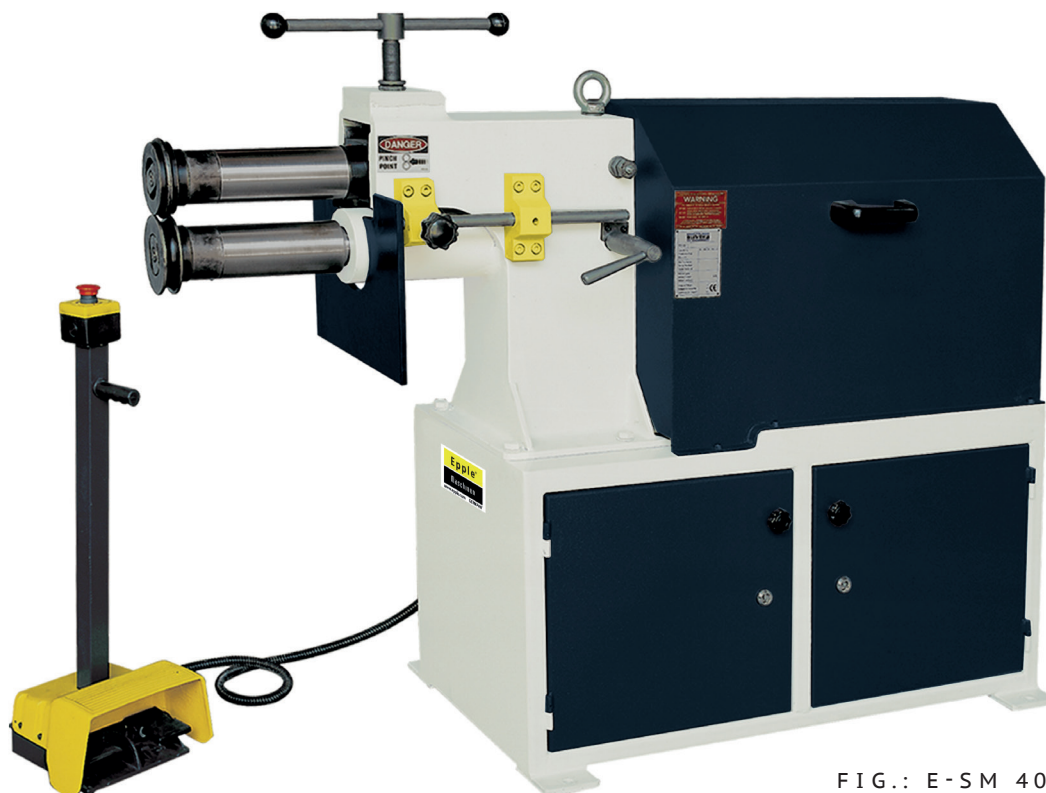
FIG.: E-SM 40 MP