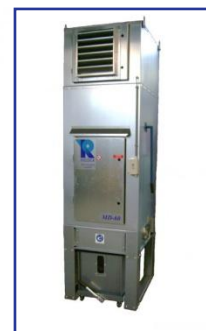
Aspiration MD 60