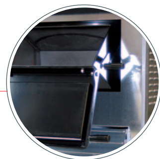
PORTELLO DI CARICO CALORY CON CONTROPORTA DI SICUREZZA. PORTE DE CHARGE AVEC CONTREPORTE DE SECURITE. DOOR FOR LOADING OF CALORY WITH SAFETY FLAP & LOCK. LADKLAPPE, CALORY MIT SICHERHEITSTÜR PUERTA DE CARGA CON CONTRAPUERTA DE SEGURIDAD