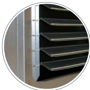
SERRANDA DI REGOLAZIONE FLUSSO ARIA. FENTES DE REGULATION DU FLUXE D'AIR. AIR FLOW REGULATION DAMPER LUFTABSPERRKLAPPE CIERRE DE REGULACIÓN FLUJO DE AIRE

L'inceneritore con generatore d'aria calda modello «CALORY» consente di trasformare gli scarti di lavorazione del legno in fonte di energia gratuita, recuperando il calore prodotto dalla combustione con l'ottenimento di aria calda distribuita in ambiente da un ventilatore elicoidale controllato da un termostato ambiente.