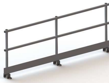
GARDE CORPS 3000MM