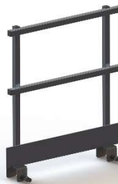
GARDE CORPS 1000MM