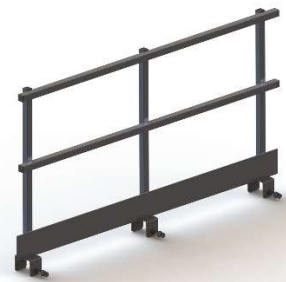
GARDE CORPS 2000MM