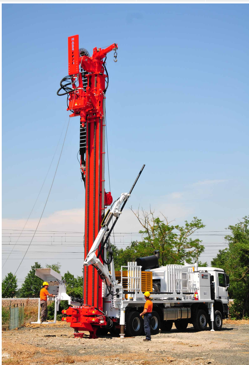
Caricatore aste con braccio Pipe loader with arm Chargeur de tiges avec bras Bohrgestänge-lader mit arm Cargador de barras con brazo Манипулятор подачи штанг