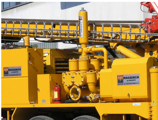
Pompa fango Mud pump Pompe à boue Spülpumpe Bomba de lodo Грязевой насос