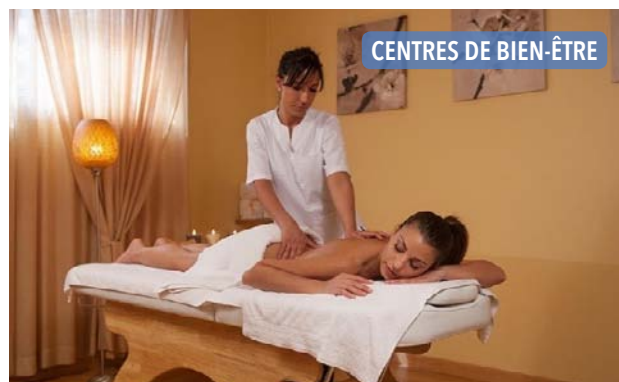
CENTRES DE BIEN-ÊTRE