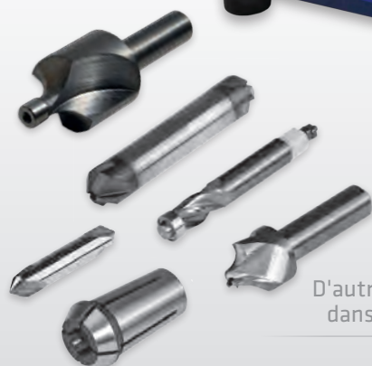
ASO 600-ASL avec règle de butée

D'autres accessoires sont disponibles dans notre catalogue d'accessoires .