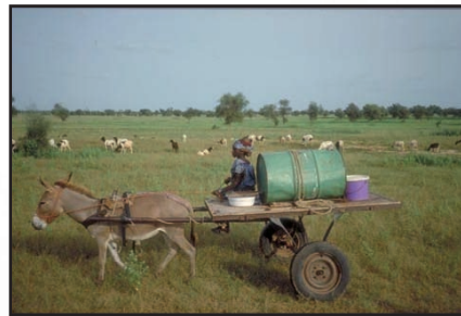
Zone sans énergie Eau de mauvaise qualité