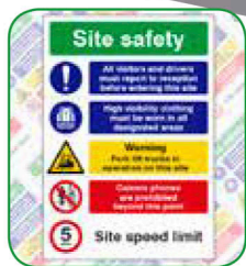
Grand panneau de sécurité : 390 mm x 555 mm. Coût : 17.00€