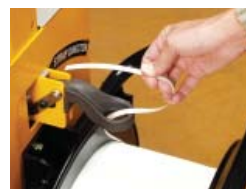
Remplacement facile de la bobine