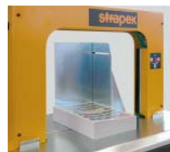
Taquage pour aligner des paquets lâches