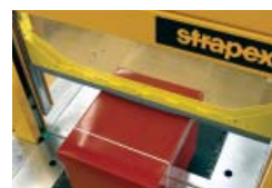
Presse pour comprimer paquets et produits lâches