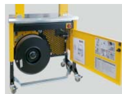
Construction robuste et compacte