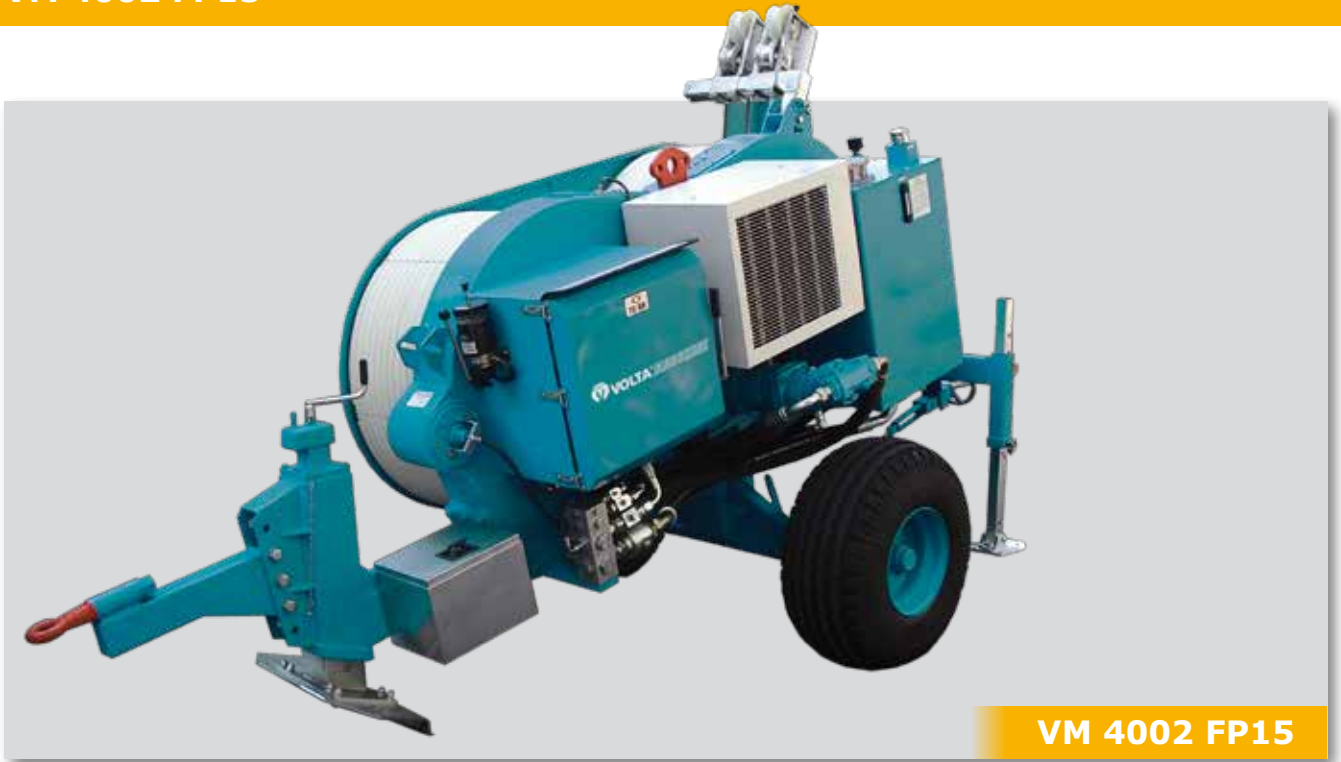
VM 4002 FP15