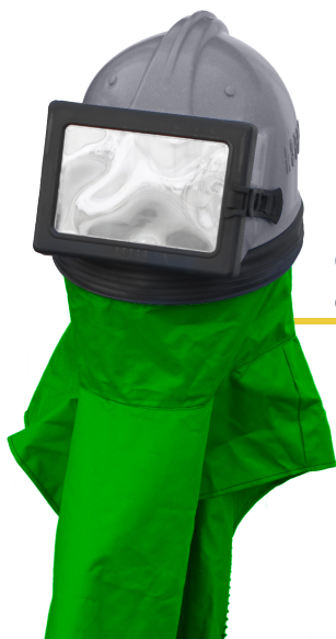
Casque de grenailage à fenêtre