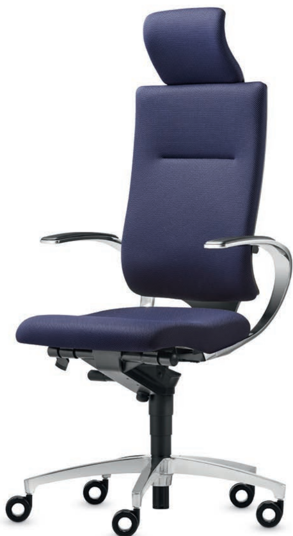
SD IT 5420 + Accoudoirs | Armleuningen AS13APO

Résolument classique. Le concept de design «noir» est élégamment classique et toujours attrayant: la concentration sur l'essentiel met la forme et la fonction au centre de l'intérêt. Le siège se distingue par son allure tout en laissant une large place à la créativité. Les accoudoirs en boucle confèrent un design très dynamique au siège tout en offrant un grand confort et soulignent la forme organique des sièges pivotants InTouch. Les sièges de conférence prennent résolument le relais de la ligne de design affinée définie par le siège de bureau pivotant.