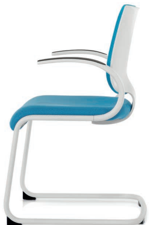
IT 5405 Manchettes (PU) | Armsteunen (PU) AA03KGS