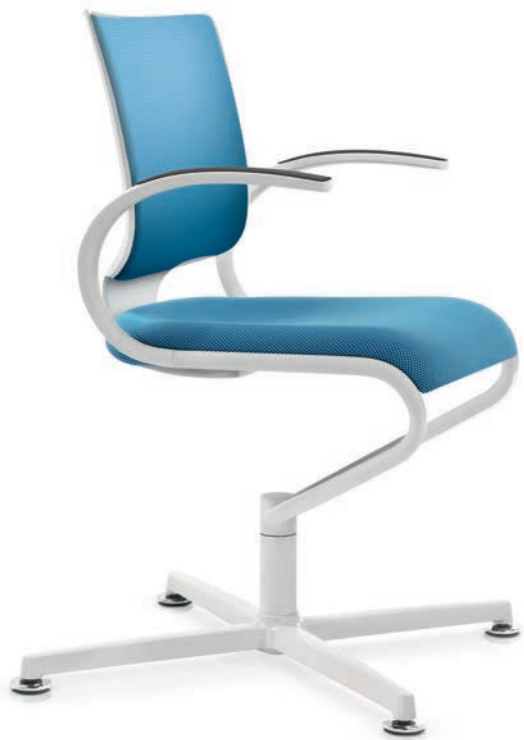
IT 5409 Manchettes (PU) | Armsteunen (PU) AA03KGS

InTouch volgt zowel met zijn driedelige zitschaal als met de op het lichaamsprofiel afgestemde rugleuning de bewegingen van de gebruiker en zorgt daarmee voor perfecte zitharmonie. Soepel en organisch steunt het elastische en flexibele Dauphin-zitsysteem het gehele houdings- en bewegingsapparaat voortdurend in direct contact met het lichaam. De white edition heeft een frisse, elegante uitstraling en laat ieder detail van het sierlijke design optimaal tot zijn recht komen.