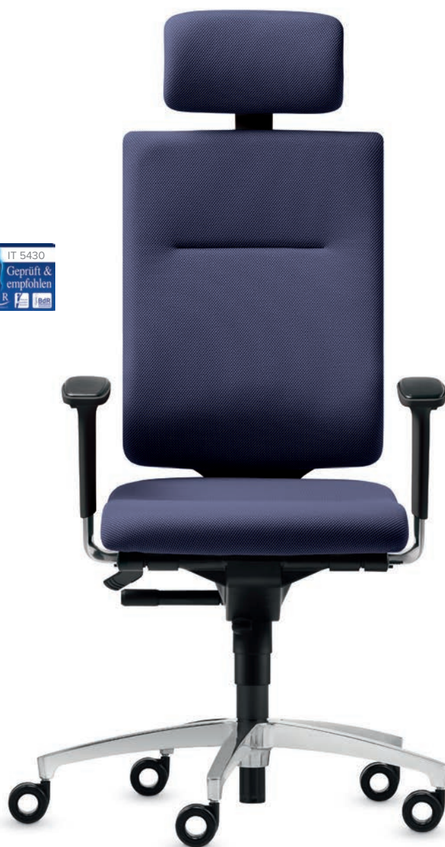
SD IT 5430 + Accoudoirs | Armleunigen A204APO