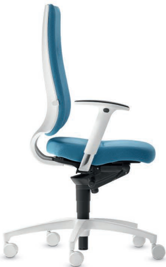
SD IT 5410 + Accoudoirs | Armleunigen A204APO