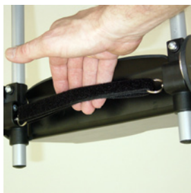
arrêt repose pied