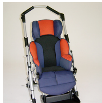
châssis gris métallisé coussin rouge/bleu + filet noir