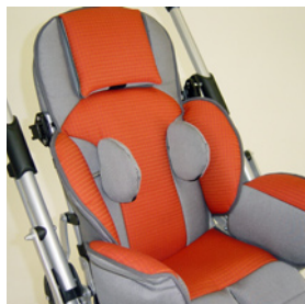
pelote de thorax