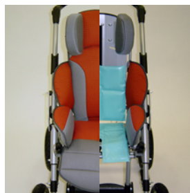
Airflex Kid système