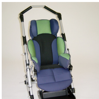
châssis gris métallisé coussin vert/bleu +filet noir