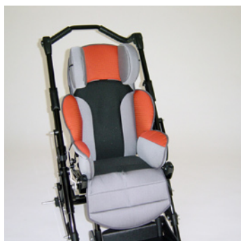
châssis noir coussin rouge/gris +filet noir