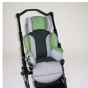
châssis noir coussin vert/gris +filet noir