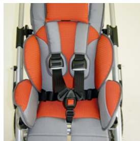
ceinture 5 points