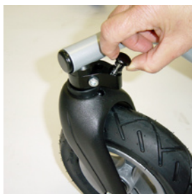
blocage des roues