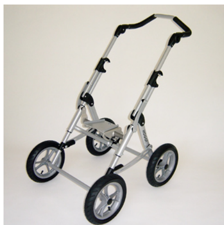
roues avant fixes