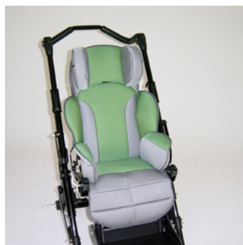
châssis noir coussin vert/gris