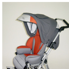
capote + protection pluie