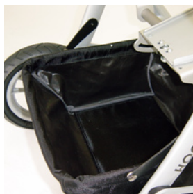
sac fourre tout