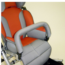
barre de protection