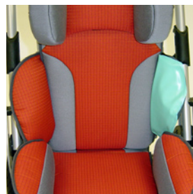
Airflex coussin latéral