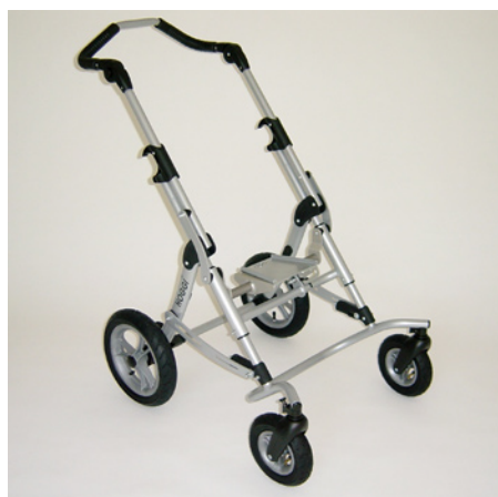
roues avant pivotantes