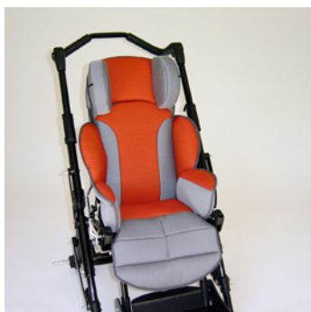
châssis noir coussin rouge/gris