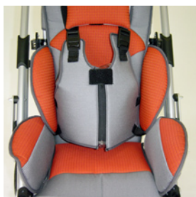
veste de maintien