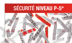
Modèle C/C - 2x15 mm Pour les documents confidentiels ou secrets.