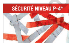
Modèle C/C - 4x40 mm Pour les documents confidentiels.