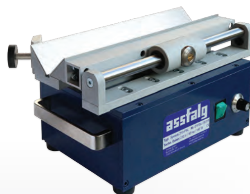
Speedy Prisma 210-PSL

Cette ébavureuse est une machines simple et solide sur plateaux stables avec un chariot coulissant prismatique pour une rectification rationnelle et précise d'arêtes longitudinales sur les petites et les plus petites pièces.