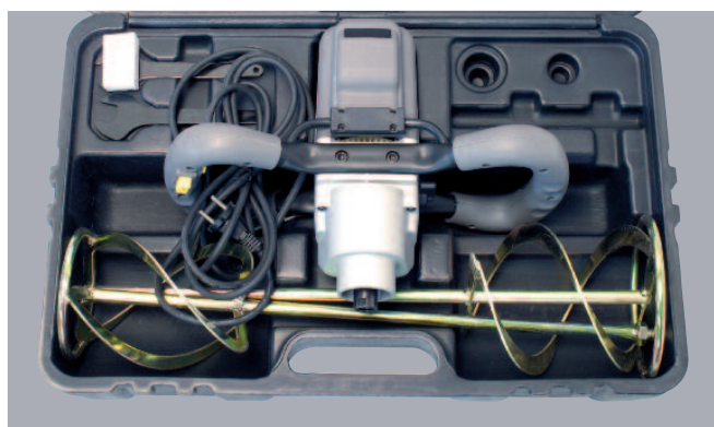
Livré dans mallette de transport