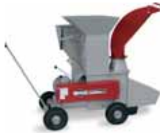
Figure : GSE 242 Combi avec éjection supérieure et inférieure. Entraînement par moteur électrique 9 kW. Article No. 94554