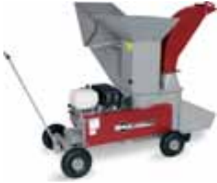
Figure : GSB 242 Combi avec éjection supérieure et inférieure. Entraînement par moteur à essence Honda de 9.6 kW. Article No. 94562

Ce sera tout ? Déchets de jardin, broussailles, plantes en pot, fleurs, tronçons des troncs, écorces, arbustes, feuillage, terre etc... Toutes ces matières, on peut les broyer avec facilité, les traiter et les recycler judicieusement.