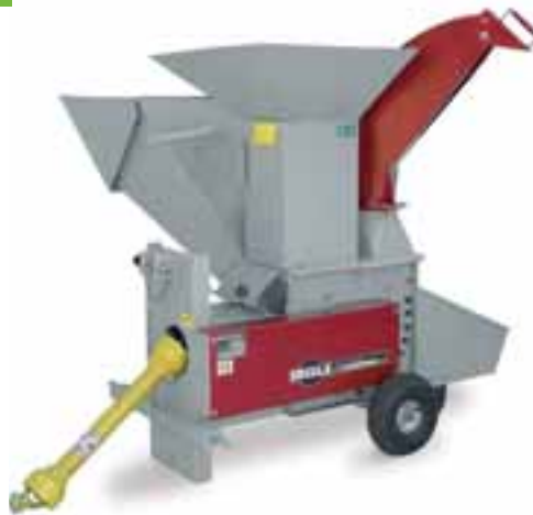
Figure : GSZ 242 Combi avec goulotte d'éjection supérieure et inférieure. Entraînement par prise de force du cardan. Article No. 94556

Arbre cardan extra. Disponible en option sur commande.