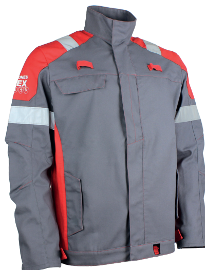
Gris Acier/Rouge 20R