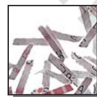
Coupe croisée 2x15 mm Niveau de sécurité DIN 4 Documents confidentiels ou secrets.