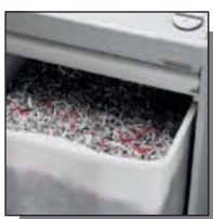
Réceptacle de 120 litres