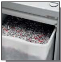
Réceptacle de 120 litres