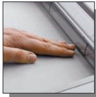
Volet de sécurité du système SPS