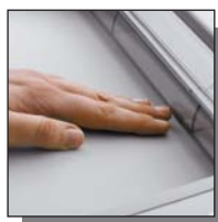
Volet de sécurité du système SPS