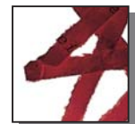
Coupe croisée 4x40 mm Niveau de sécurité DIN 3 Documents confidentiels.