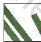
Coupe fibres 4 mm Niveau de sécurité DIN 2 Documents internes.