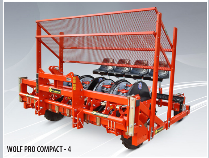
WOLF PRO COMPACT - 4

La distanza di lavoro tra una pianta e l'altra sulla fila è fissa e correlata al numero delle tazze montate al distributore. Quanto sopra consente di aprire un foro sulla pacciamatura della dimensione minima possibile. Disponibili 4 diverse tazze perforatrici, STANDARD (A - max 8 tazze) o LUNGA (B - max 7 tazze) per zolle coniche o piramidali, per zolle cubiche fino a 6x6 cm (C - max 7 tazze) o per zolle cubiche fino a 8x8 cm (D - max. 7 tazze).