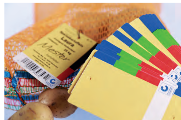
Etiquette carton pour les fruits et légumes