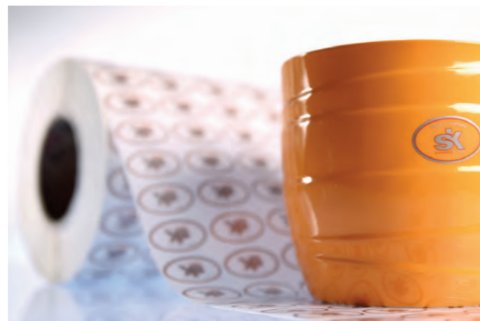
Etiquette autocollante de marque pour des céramiques