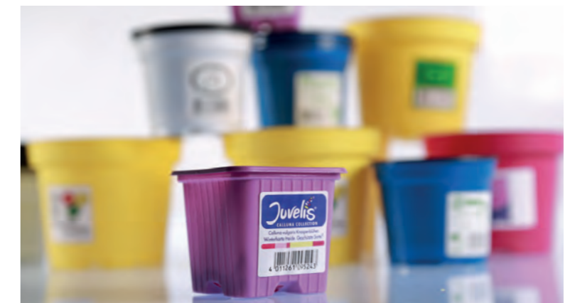
Etiquette autocollante informative pour matériels de jardinage.