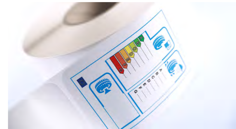
Etiquette autocollante avec adhésif spécial pour l'étiquetage de pneus

Nous vous proposons de multiples solutions d'étiquettes adaptées à la perfection à vos besoins. Les matières d'étiquettes et adhésifs font l'objet d'innovations et d'améliorations continues. Nous connaissons toutes les aspects du marché – contactez-nous!