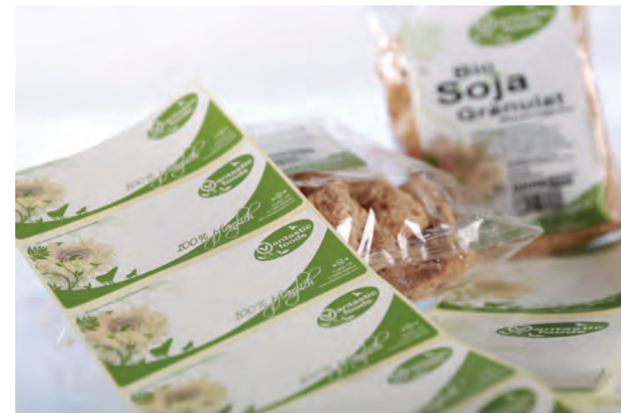
Etiquette autocollante préimprimée pour produits Bio