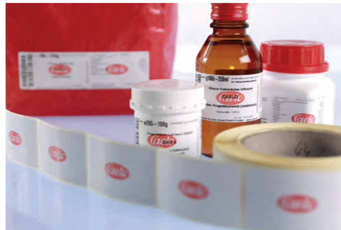
Etiquette autocollante préimprimée pour produits de santé