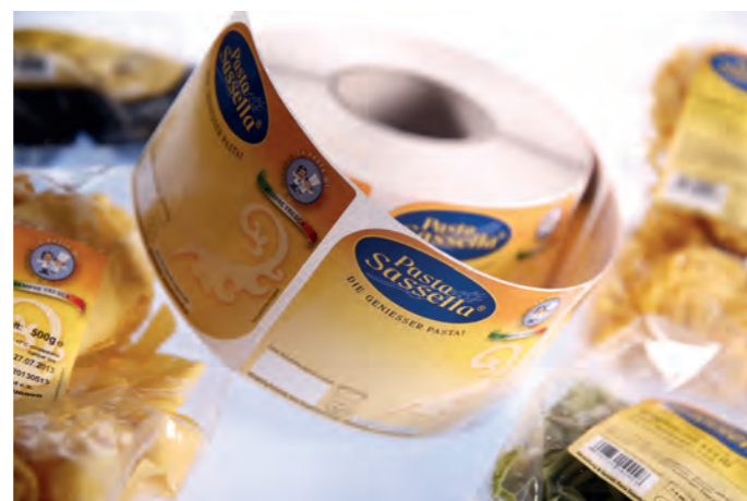
Etiquette autocollante découpée à la forme pour des pâtes