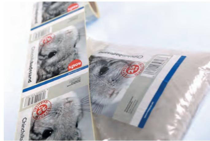
Etiquette de marquage autocollante pour matériels pour animaux

Depuis plus de 30 ans, les entreprises de tous les domaines font confiance à la compétence en matière d'étiquettes de systèmes Weber.