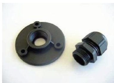
Kit de montage en gaine pour sonde humidité/température nSens HT

Sonde humidité/température nSens HT intelligente et débouchage avec filtre de protection mécanique (longueur de câble de 3 à 30m).