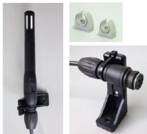
Kit de montage murale pour sonde humidité/température nSens HT.