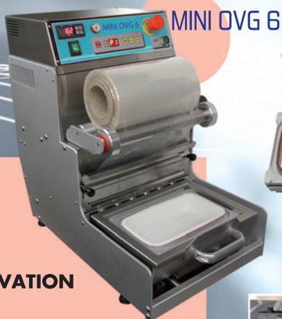
MINI OVG 6