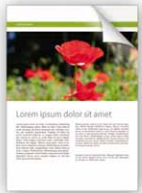
Impression couleur normale