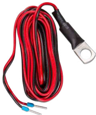
Sonde de température pour les appareils Quattro, MultiPlus et GX (par exemple Ekran GX) en tant qu'accessoire supplémentaire.