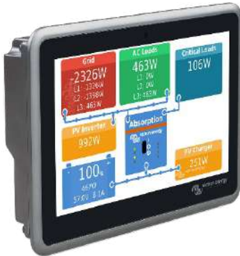
Ekran GX avant et arrière