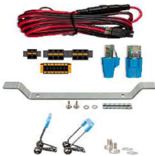
Accessoires inclus avec l'Ekran GX