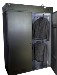
Modèle 12 personnes