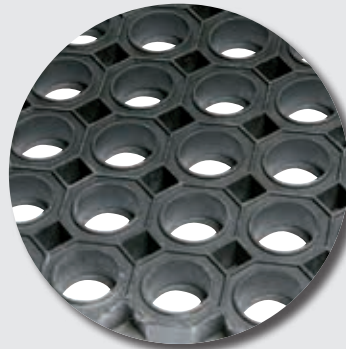
Face supérieure M69 / M69M1F1