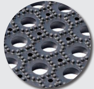
Face inférieure M69 / M69M1F1