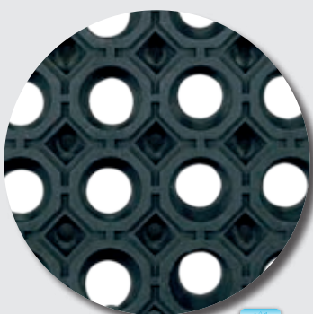
Face supérieure M69PLUS