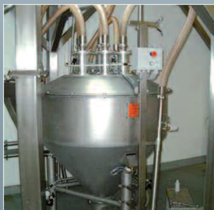
Trémie de transfert sous vide avec pesée pour introduction dans des fondoirs