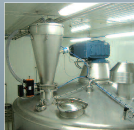
Alimentation d'une cuve de mélange sans risque de remontée de vapeur