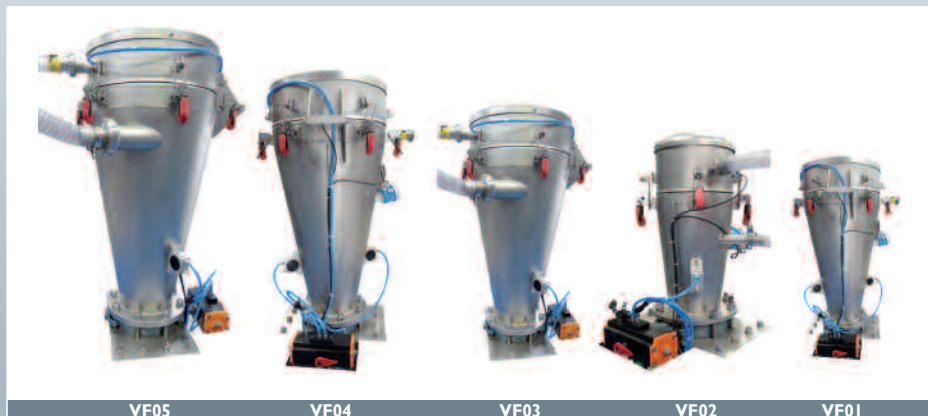
La gamme standard V-Flow de 5 à 10 000 l./h.