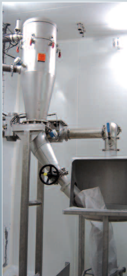
Skid de poudrage avec gestion des pesées et purge de ligne