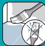
Ne peluche pas