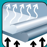
Absorbant / perméable à la vapeur