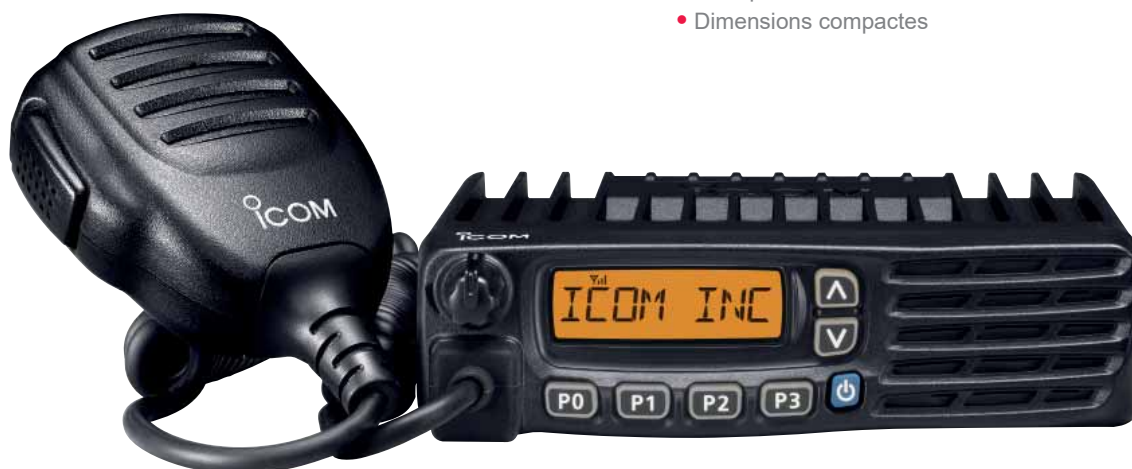
IC-F5122D (VHF) IC-F6122D (UHF)