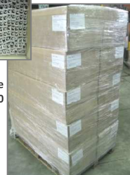
Palette 1200x800 filmée Hauteur 5 colis 1600mm