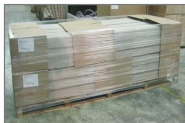
Palette 1200x3000 filmée Hauteur 1000mm Carton 600x400x300