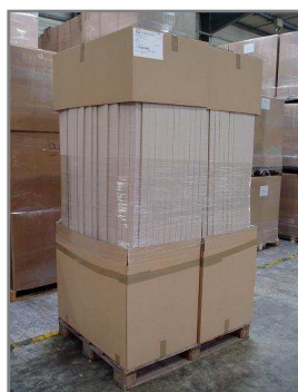
Palette 1200x1000 filmée Hauteur maxi 2400mm Carton bas 992x585x675 Carton haut 992x585x400