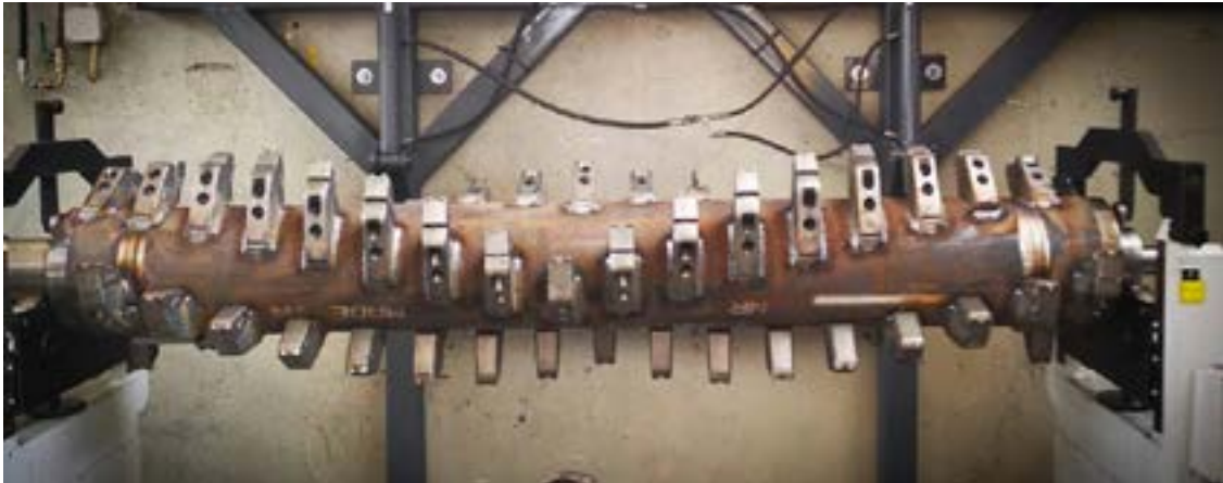
MARTEAUX FIXES AVEC ROTATION À 180°