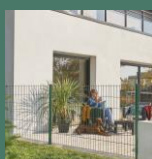
Panneau AXOR® Chic