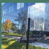
Panneau AXYLE® MS / CS / MD / CD