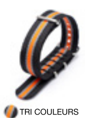
● TRI COULEURS

Doomap, propose plusieurs couleurs, afin de différencier facilement les dispositifs pas services ou par personne.