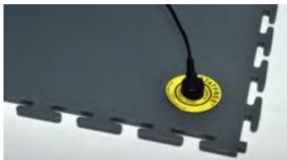
5 ET 7 mm ESD ANTISTATIQUE Texture lisse 'martelé'