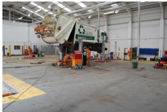
Rénovez vos sols industriels rapidement sans travaux