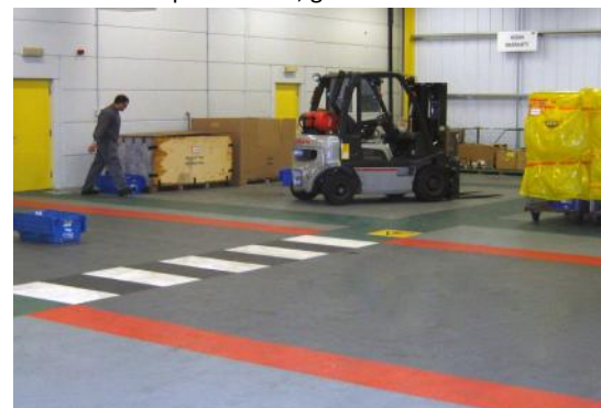
L'unique solution réparable en quelques minutes.