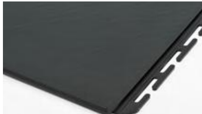
6 mm Texture 'ardoise'