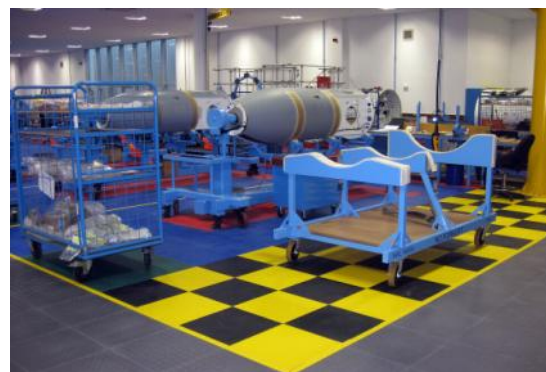
Depuis 20 ans, garantie 10 ans