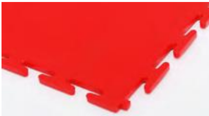
7 mm Texture lisse 'martelé'