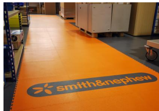
Dallindus 7 et 10 mm : marquage et logos au sol