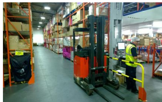
Dallindus 10 mm pour les contraintes sévères