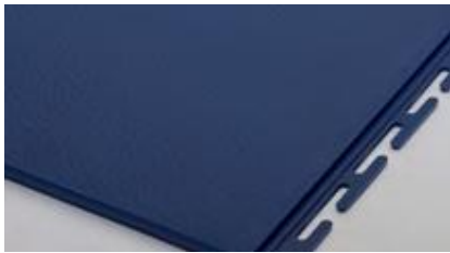
6 mm Texture lisse 'martelé'