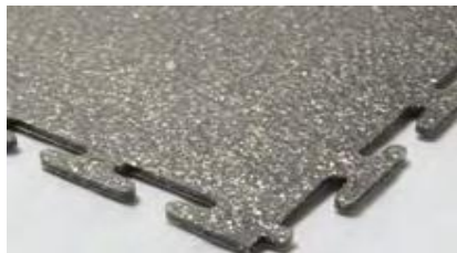
5 mm DECORATIVE 'pailleté' Texture lisse 'martelé'