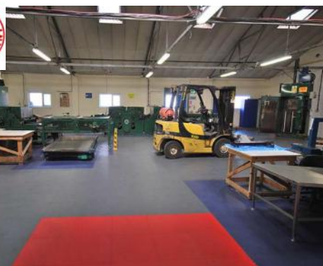
Rénovez vos sols industriels rapidement sans travaux