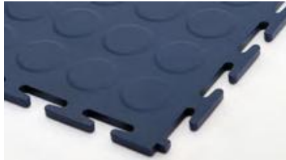
7 mm Texture 'pastille'