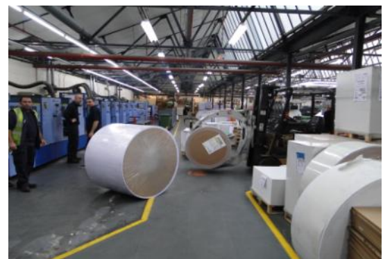
L'unique solution réparable en quelques minutes.