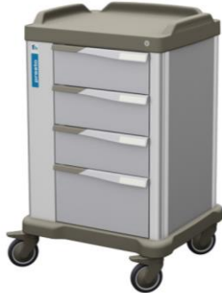
PRESTO 400 (Medium)