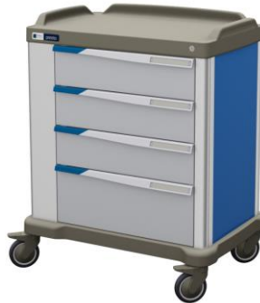
PRESTO 600 (Large)