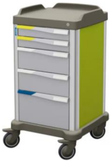
PRESTO COMPACT (Small)

Fiche technique : Chariot multifonction PRESTO, glissières télescopiques pour tiroirs façade 600 et 400 https://www.francehospital.com/fr/produits/chariots/presto/