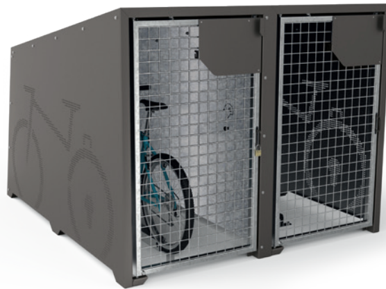
■ Réf. 529450 + 529454 + 529455

Arceaux antivol : sur platines avec trous Ø 9 mm, finition galva (ancrage non fourni).