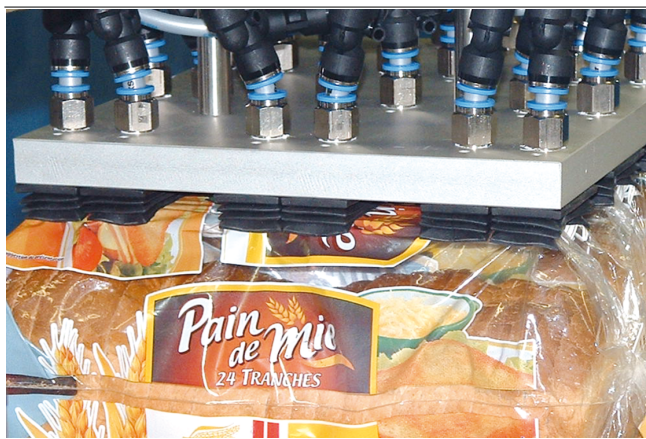
Ventouses à soufflets FSGB-R pour la manipulation d'emballages