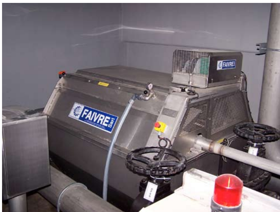
Filtre 9-120 sur cuve

Photos et données techniques non contractuelles, la société Faivre sarl se réserve le droit de modifier les caractéristiques de ses machines quand elle le souhaite.