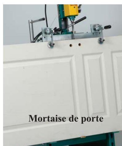
Mortaise de porte