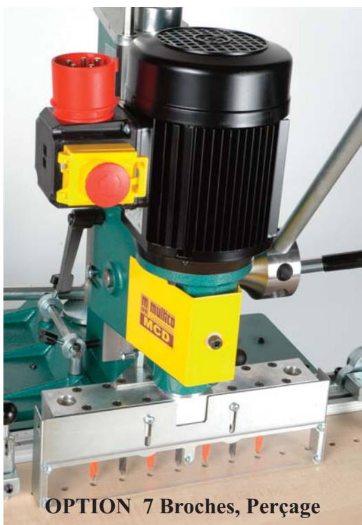
OPTION 7 Broches, Perçage