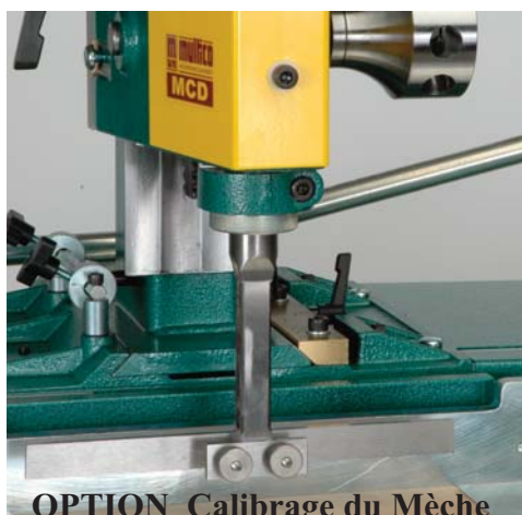
OPTION Calibrage du Mèche