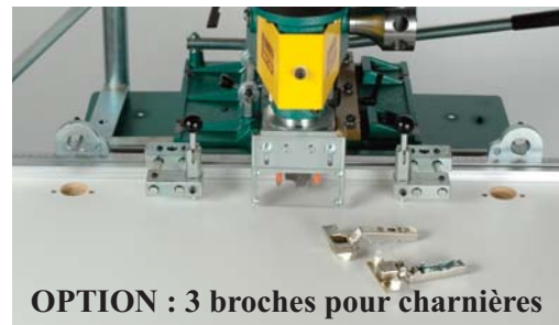
OPTION : 3 broches pour charnières