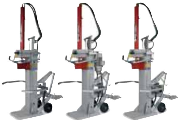
USP 13 H/5 pour le branchement sur le système hydraulique du tracteur