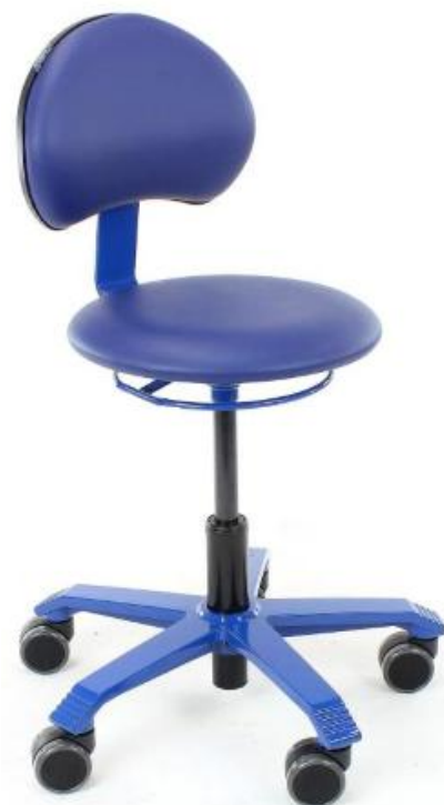
PICO STAMSKIN : assise rembourrée pour davantage de confort

Le PICO est spécialement conçu pour les environnements de petite enfance (crèches et maternelles).