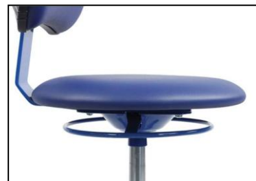
Commande très pratique par anneau sous l'assise

Le STAMSKIN est un similicuir de haute performance destiné aux usages intensifs et aux contraintes techniques spécifiques ( milieu agressif, médical, etc. ). Il est extrêmement résistant à l'abrasion, et bénéficie d'un traitement Sanitized (antibactérien) . Garanti sans phtalates , il convient parfaitement aux environnements de la petite enfance pour sa résistance, son hygiène et sa facilité d'entretien.