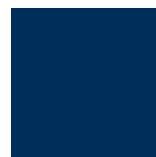
Avec piètement bleu