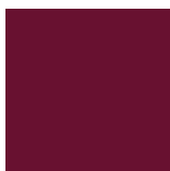
Avec piètement rouge