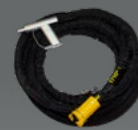
FAISCEAU PISTOLET LONGUEUR 10 M

Pour plus de renseignements sur nos accessoires contactez-nous.