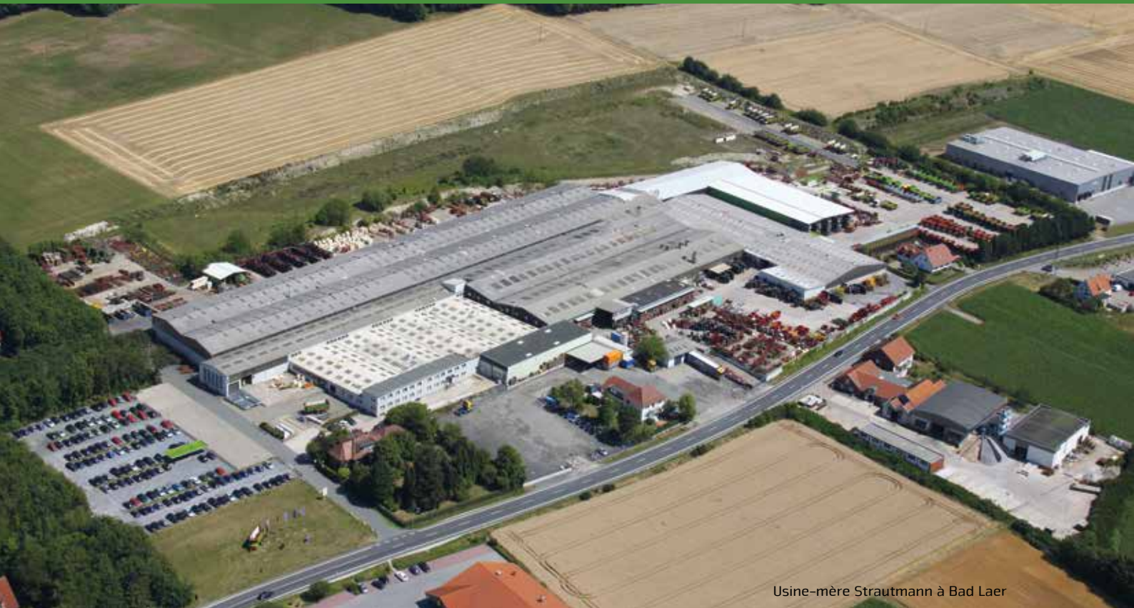
Usine-mère Strautmann à Bad Laer

La société B. Strautmann & Söhne GmbH u. Co. KG est une entreprise familiale de taille moyenne située dans le sud de la Basse-Saxe, désormais dirigée par la troisième génération après plus de 80 ans d'existence. Sur son deuxième site de production, l'usine moderne de Lwówek en Pologne, Strautmann produit également une partie de la gamme de machines, comme des bennes basculantes, des godets désileurs ou