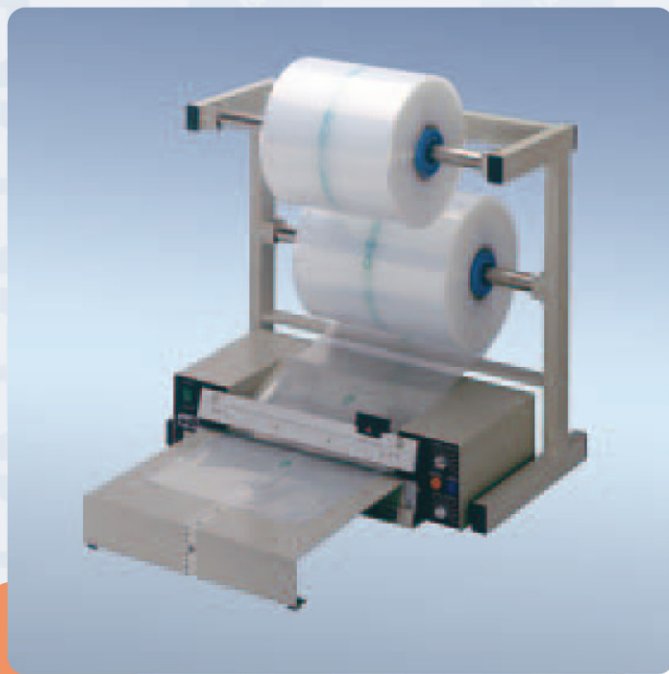
Polystar 401 M

avec tablette détachable et magasin de rouleaux