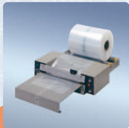
Polystar 401 M

avec tablette détachable et magasin de rouleaux