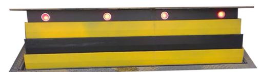
Bloktruck MAXI Pose fixe encastrée Hauteur de blocage 80 à 120 cm