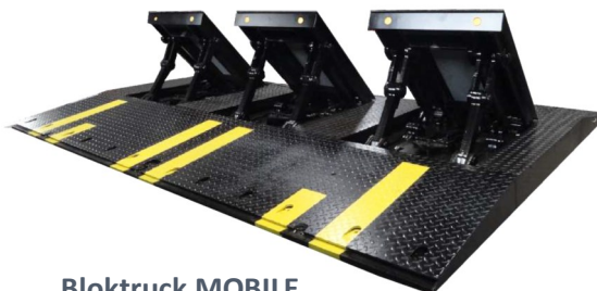
Bloktruck MOBILE Pose en surface uniquement Hauteur de blocage 57 cm