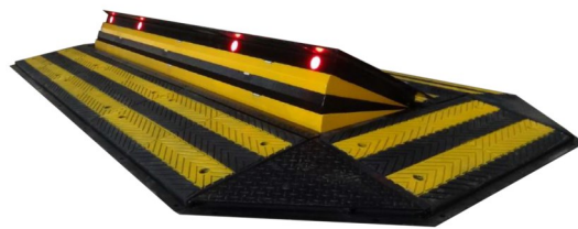
Bloktruck MINI Pose fixe encastrée Option : Pose surface Hauteur de blocage 35 cm

Institutions Centrales nucléaires Sites industriels Zones commerciales Aéroport Centre d'affaires Hôtels Complexes sportifs Zones de loisirs Zones urbaines Ecoles, universités