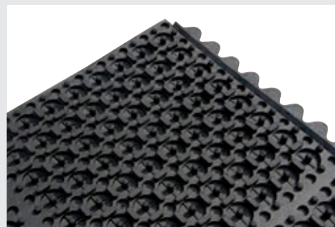
Connexions de la face inférieure