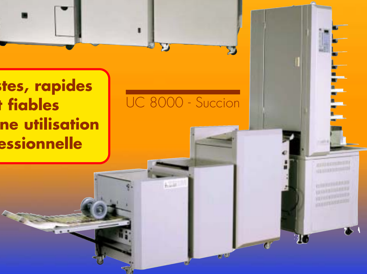
UC 8000 - Succion

Robustes, rapides et fiables pour une utilisation professionnelle