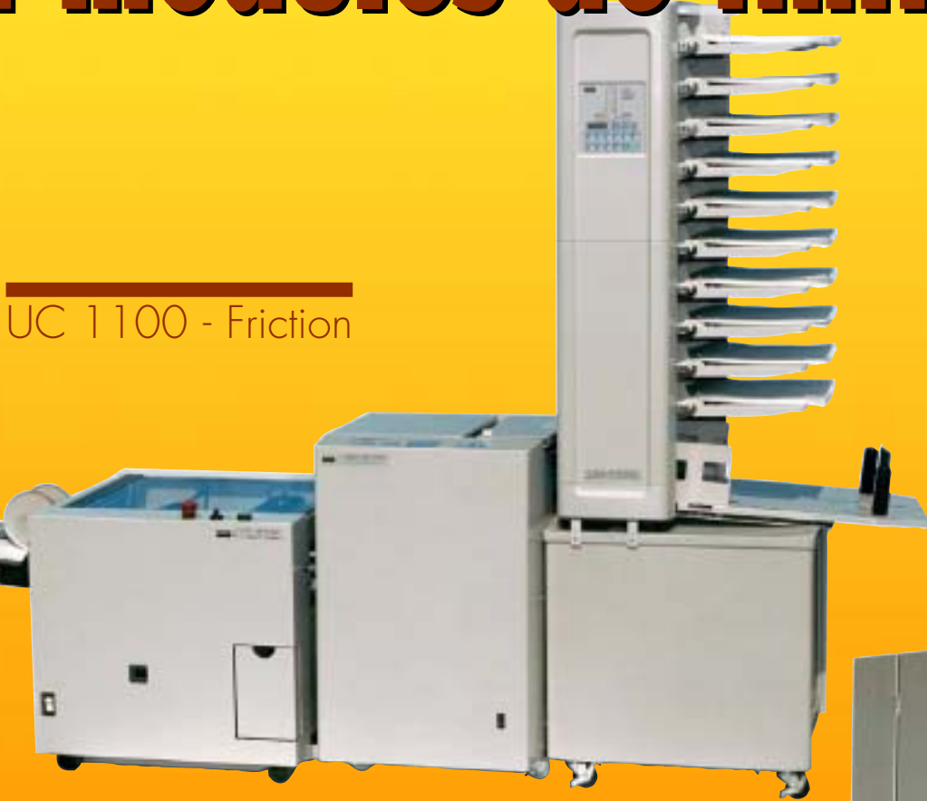
UC 1100 - Friction

Robustes, rapides et fiables pour une utilisation professionnelle